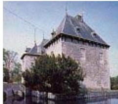
Kasteel - Amsterrather Haus

Achter de kerk (1707) ligt het kasteel Amsterrather Haus (2) ook Herrebhaus genoemd. (1431), omgeven door een gracht: op slechts enkele meters afstand, de ruïne van het Vlattenhaus.