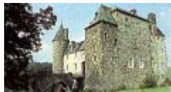
Kasteel Steveströp of Graaf

We vinden de kastelenroute terug aan het viaduct, richting Montzen.