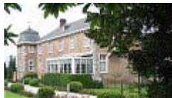
Kasteel Hof de Draeck

Hier bevindt zich (200 m in de Hofstraat) het kasteel Hof de Draeck (17) (Hostellerie) (16de eeuw) en, aan de andere kant van het dorp, de oude beïndrukwekkende abdij behorende tot de zusters van de M Augustin Orde, ook Kasteel Sinnich (18) genoemd.